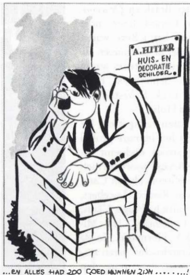
Karikatuur uit Karel L. Links' „De moffenspiegel”, uitgegeven door De Bezige Bij in 1944.

De eerste uitgave van De Bezige Bij was de bekende rijmprint De achttien doden van de