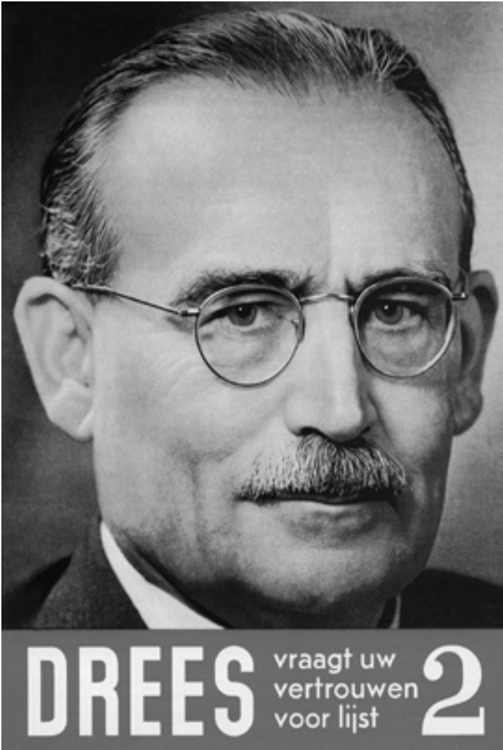
Verkiezingsaffiche uit 1952, naar een ontwerp van Jan Roede

[Collectie Documentatiecentrum Nederlandse Politieke Partijen, RU Groningen]