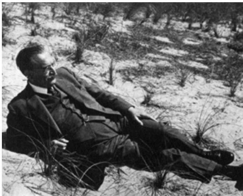
Willem Drees tijdens een zondags bezoek aan de duinen bij Den Haag, 1949