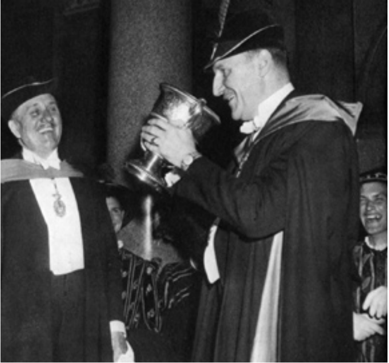
Joseph Luns etc. [jaar?, waar?]