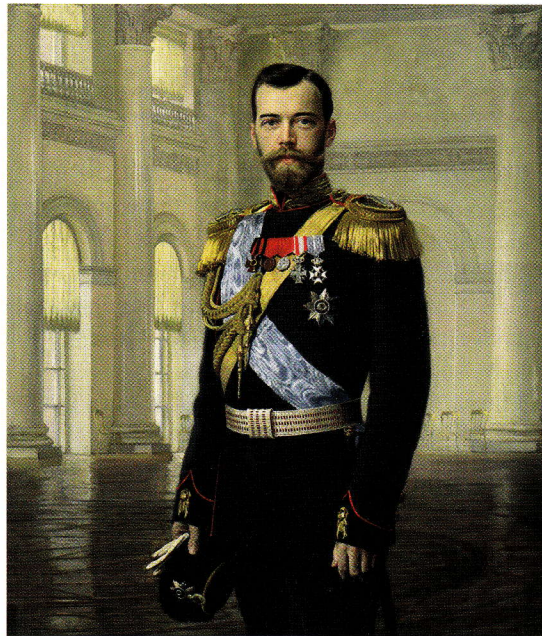
ALLEEN NICOLAAS II ZAG NOOIT EEN ONDER- DAAN Schilderij door E.F. von Liphart uit 1900.

Van jongs af aan hadden de drie neven contact, en dat hield niet op