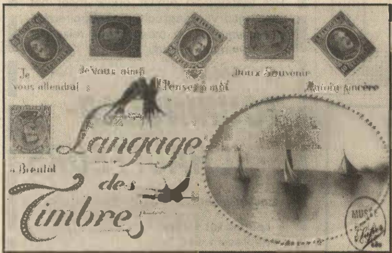
De taal der postzegels.