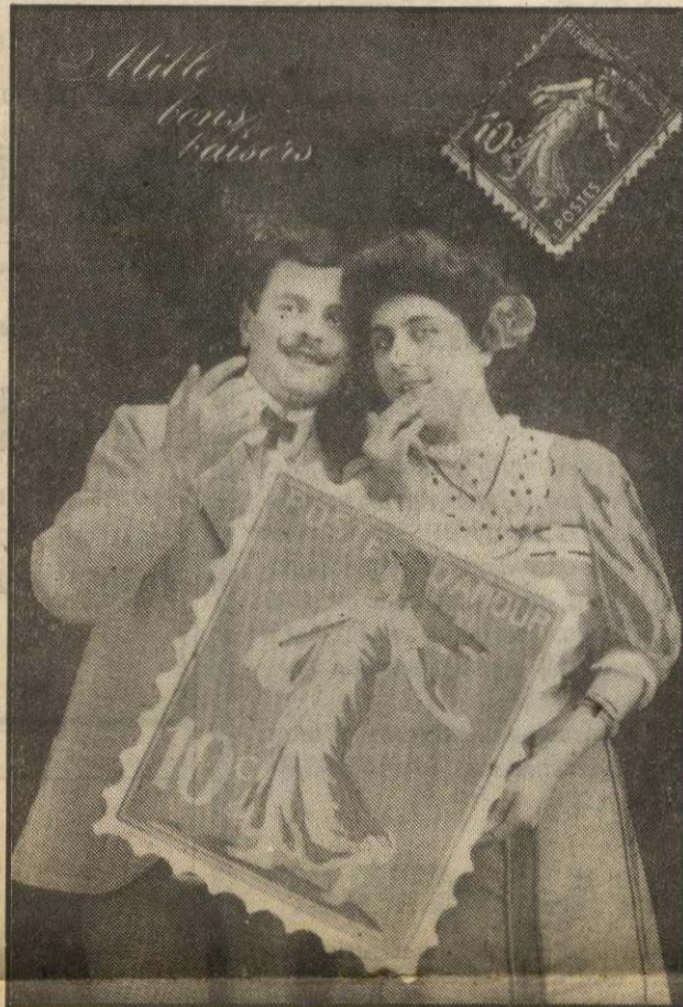
Kaart uit de verzameling van Paul Eluard: Duizend kusjes.