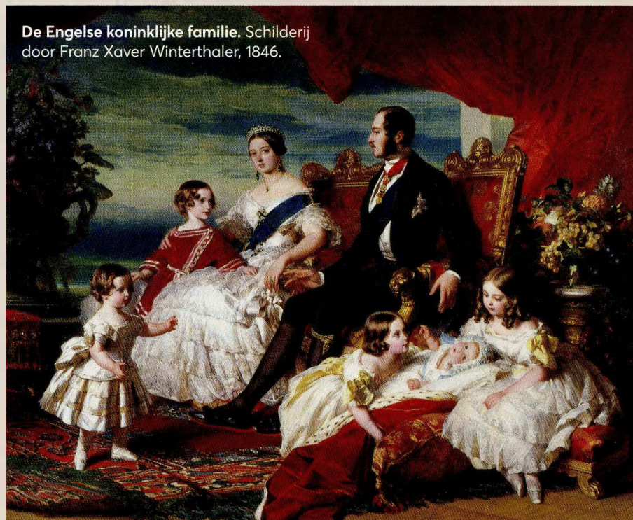
De Engelse koninklijke familie. Schilderij door Franz Xaver Winterthaler, 1846.