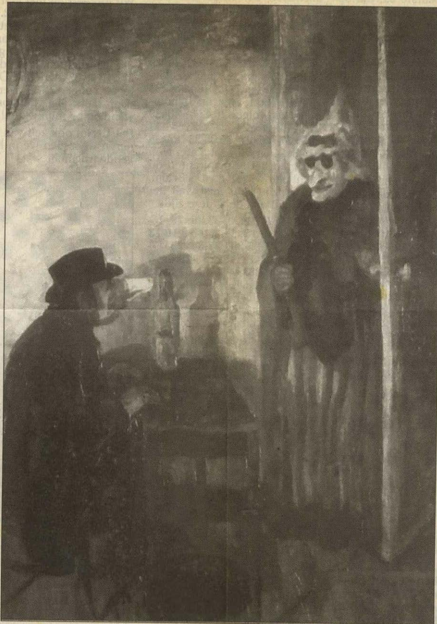
James Ensor, Geërgerde maskers , 1883.

In deze tijd van individualisme en persoonlijke geldingsdrang is het bijna niet meer voor te stellen hoe deze negentiende-eeuwse traditie klaarblijkelijk nog steeds aanhangers vindt. Recensenten zijn recensent bij de gratie van hun naam en persoonlijkheid. En omgekeerd: recensenten vestigen hun naam door middel van hun recensies, ze bouwen een reputatie op. Natuurlijk telt de inhoud van een recensie ook, maar de persoon die er achter zit geeft daaraan extra gewicht. Vroeger was het de status van een krant zelf (de krant is een meneer!) die de teneur van een recensie autoriteit verleende.