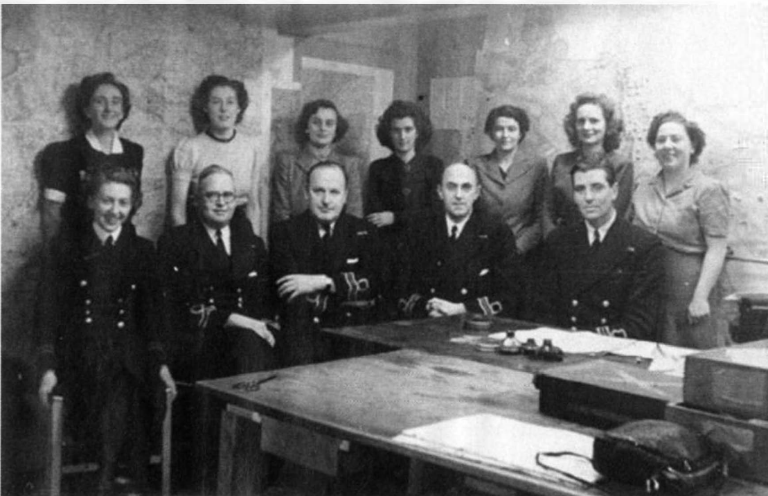
Het MI5-team dat Operation Mincemeat leidde. Het gaf een overleden outcast een compleet nieuwe biografie