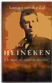
Gerard Heineken. De man, de stad en het bier Annejet van der Zijl 256 p. Querido & Uitgeverij Bas Lubberhuizen, € 19,95

Toen Gerard Heineken (1841-1893) op 20-jarige leeftijd zijn vader verloor en een mooi kapitaalje erfde, had hij rustig kunnen gaan leven. Hij deed het tegenovergestelde. Gerard kocht aan de Nieuwezijds Voorburgwal in Amsterdam een kwijnende bierbrouwerij op. Hoewel hij niets van bierbrouwen wist, ging hij voortvarend aan de slag. En onorthodox. Hij kaapte klanten bij de concurrent weg en het werd hem bepaald niet in dank afgenomen dat hij ook bier namaakte, zoals de Rotterdamse brouwerij d'Oranjeboom merkte.