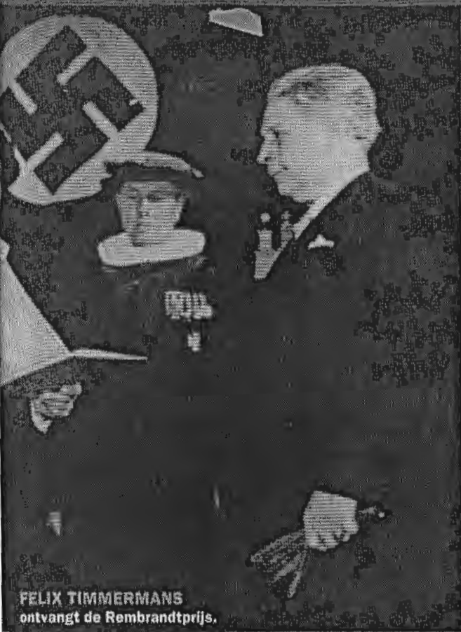
FELIX TIMMERMANS ontvangt de Rembrandtprijs.