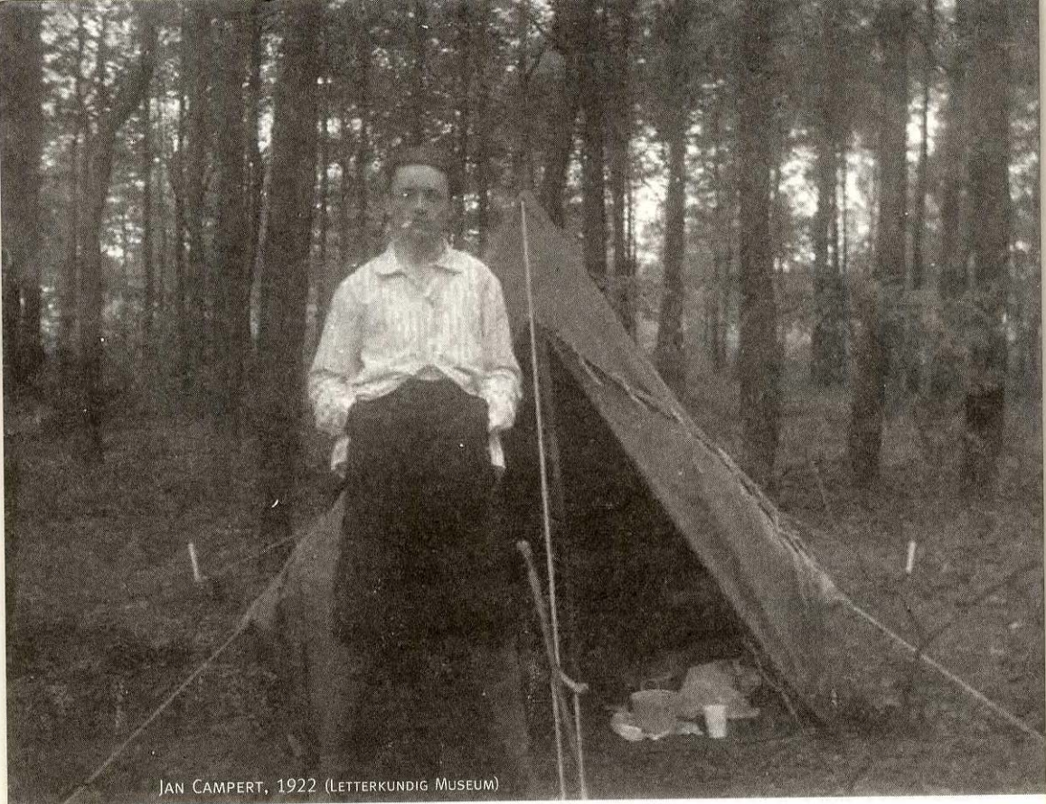
JAN CAMPERT, 1922