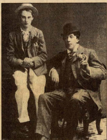
Lord Alfred Douglas op vijfenveertigjarige leeftijd. Onder: Douglas en Oscar Wilde in 1894.