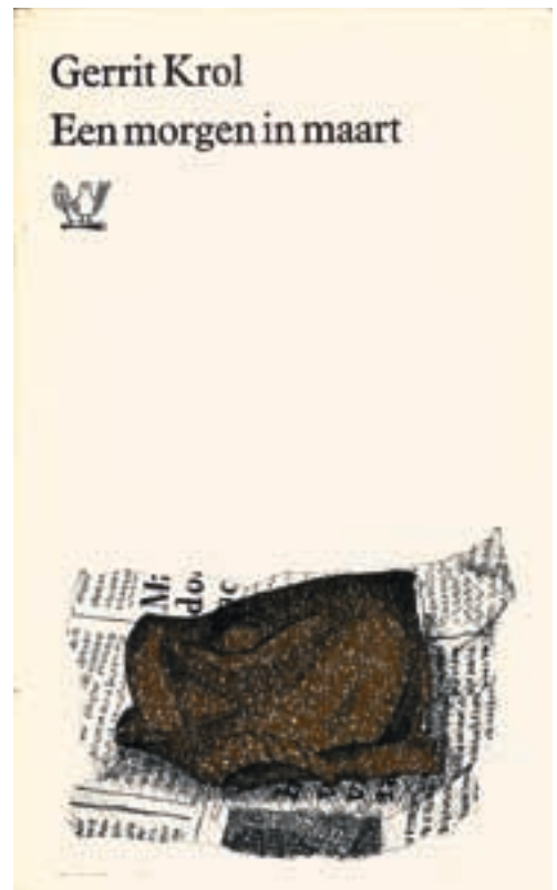
[L] · [R] Omslag van Een morgen in maart door Gerrit Krol, 1967. Het omslagontwerp is van Ary Langbroek