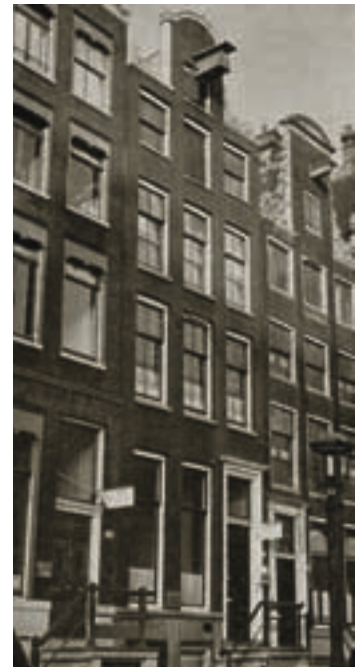
[L] Alice van Eugen en Belcampo bij het vijftigjarig bestaan van Em. Querido's Uitgeverij, 1965 · [R] Singel 262