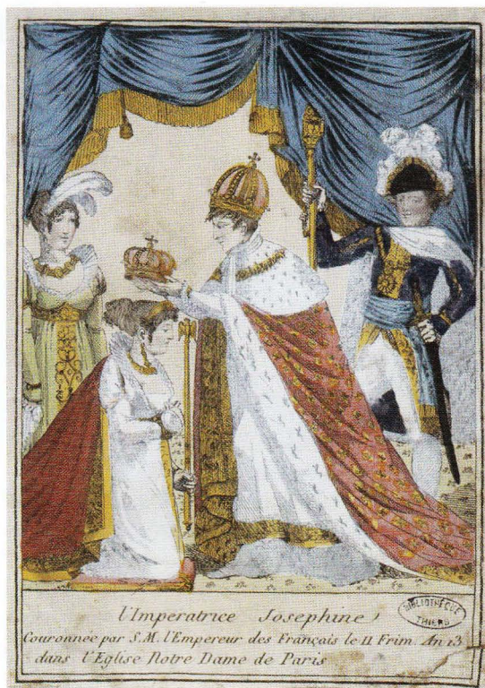
KEIZERIN NAPOLEON KROONDE ZIJN JOSÉPHINE EIGENHANDIG Gravure uit 1804.

Joséphine spendeerde miljoenen aan kleding, meubels en diamanten. Nadat Napoleon het buitenverblijf