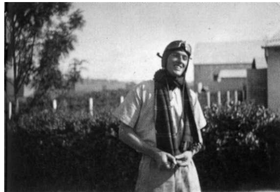
Dahl tijdens zijn vliegenierstraining, Nairobi, 1939

Roosevelt. De first lady was zo verrukt van The Gremlins dat zij de auteur ervan uitnodigde voor een bezoek. Dahl was een man in bonus, hoewel hij maar twintig procent van zijn royalty's mocht houden - de rest ging naar een noodfonds voor RAF-piloten. De enige luxe die de schrijver zich permitteerde was een bezoek aan de tandarts, waar hij al zijn tanden liet trekken en een mooi kunstgebit aanschafte. Nooit heeft Dahl verteld of geschreven hoe hij vervolgens bij de British Security Co-ordination (BSC) terecht kwam. Het was een schimmig spionageclubje dat de Britse belangen in Amerika moest behartigen. De latere reclame-tycoon David Ogilvy, James Bond-auteur Ian Fleming en de detectiveschrijver Valentine Williams zijn sprekende voorbeelden van lieden die voor 'Churchills geheime leger' gerecrueteerd werden door de baas van BSC, William Stephenson.