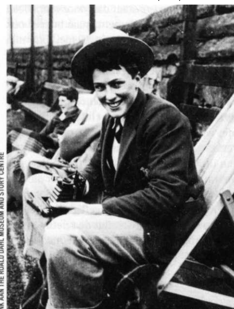
LINK AAN THE ROALD DAHL MUSEUM AND STORY CENTRE