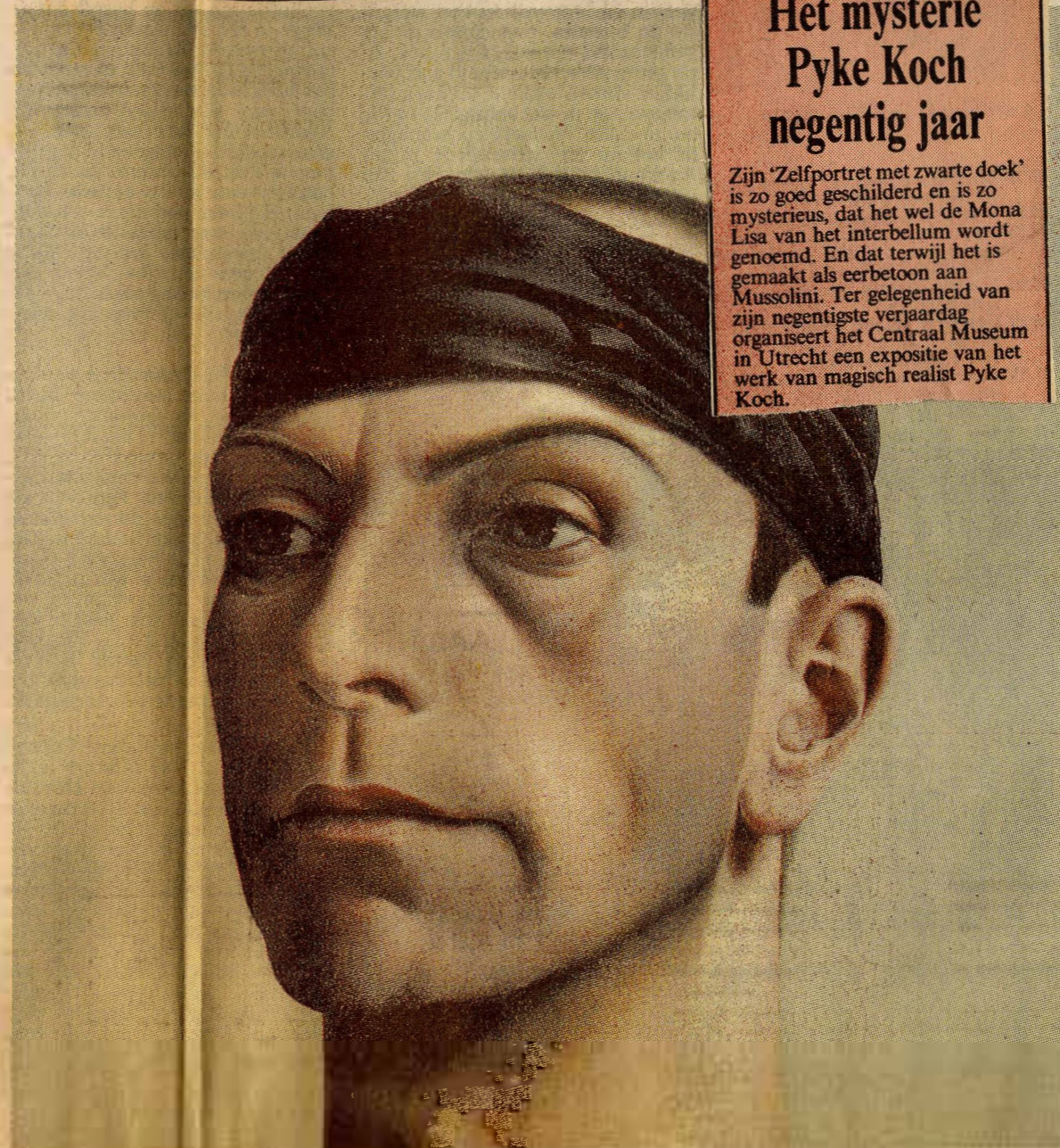
'Zelfportret met zwarte doek': hommage aan Mussolini.

Koch werd in 1901 te Beek (bij Nijmegen) geboren. Zijn vader was een plattelandsdokter die het raadzaam achtte om zijn zoon, die een achterstand op de lagere school had opgelopen als gevolg van een ziekte, op kostschool te doen. Daarom verhuisde Pyke naar Zetten, later verkaste hij met het internaat mee naar het Zeister Slot. Het toeval wil dat deze zomer in hetzelfde Slot Zeist een verkooptentoonstelling van magisch realistische schilderijen werd gehouden waar onder meer twaalf interessante doeken van Koch te zien waren. De prijzen waren er dan ook naar. Zo moest een klein stilleven met twee vrouwen