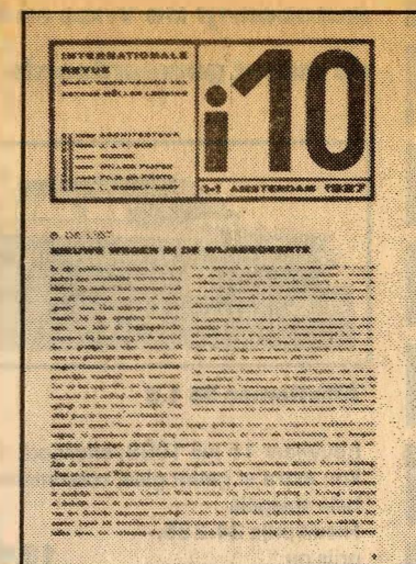
Twee van de tien ontwerpen van het 'i 10'-logo.